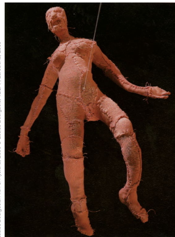
Louise Bourgeois. Arch of Hysteria, 2000 © Louise Bourgeois, VEGAP, Barcelona, 2009

A partir de 16 anys Mínim 10 persones Places limitades