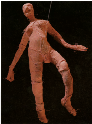
Louise Bourgeois Arch of Hysteria , 2000 © Louise Bourgeois, VEGAP, Barcelona, 2009