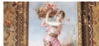
Les Quatre Estacions