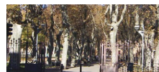
Els arbres de Can Mercader i Què sabem de l'hort?