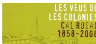
Les veus de les colònies