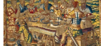
Descobrint els FRUCTUS BELLI als tapissos del Museu...