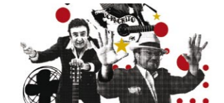
Al ritme dels gitanos catalans