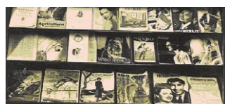
Mostra del Fons Local de la Xarxa de Biblioteques de Cornellà