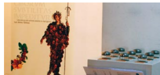
Alimentum. Menjar i beure a l'època romana