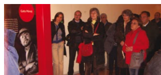
Les Mil i una rumbes. 50 anys de rumba catalana