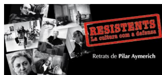
Resistents. La cultura com a defensa. Retrats de Pilar Aymerich