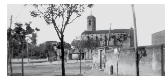
Cada pedra al seu temps