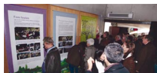
De la llavor als fruits