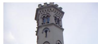
Observem el clima des de la Torre de la Miranda