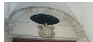
Seguint la pista Mercader per Barcelona